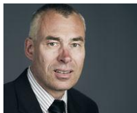
+++ Zusammenbruch 2015 +++