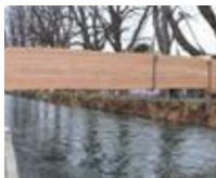
Die Brücke musste zwischen den Bäumen durch