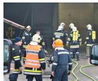
Feuerwehr verhinderte Großbrand im Lagerhaus